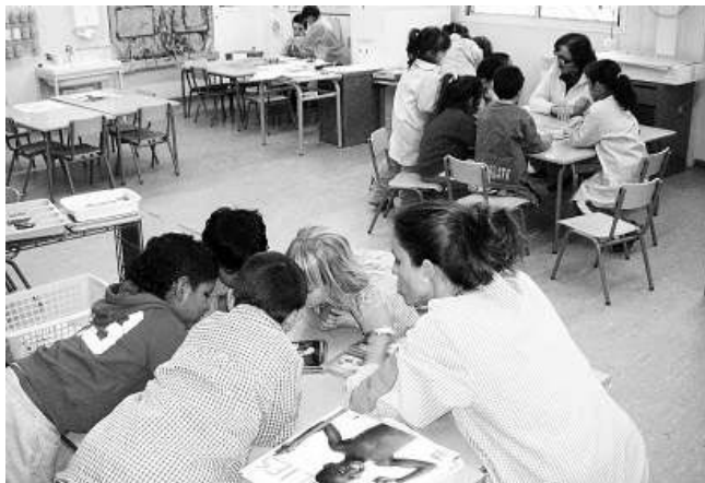
Diversos alumnes en una aula de l'escola Carrilet de Palafrugell.